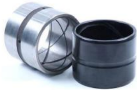
斗轴套 BUCKET BUSHING