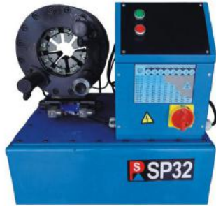
Hose Crimping Machine SP32

Motor power:1.5~2.2KW Full Crimping Cycle:16~20s Weight:130kg MAX Hose ID:32mm Dimensions:600*450*650 Accuracy:0.01mm Die Opening&Closing:1-50mm Voltage:220V~380V