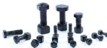
履带螺栓螺母 BOLT AND UNT