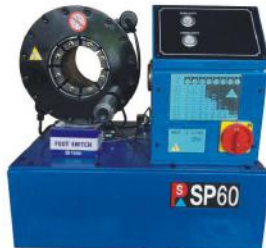
Hose Crimping Machine SP60

Motor: 3kw Full Crimping Cycle: 10s Weight: 250kg Max Crimping Force: 450T Dimensions: 700*400*700mm Accuracy: 0.01mm Die Opening & Closing: 1-50mm Voltage: 380V