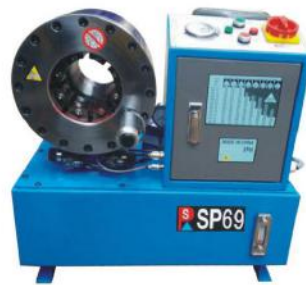
Hose Crimping Machine SP69

Die Opening&Closing:25-35mm Weight:200kg Max Crimping Force:600T Motor Power:3kw Full Crimping Cycle:8s Accuracy:0.01mm Voltage:380V Dimensions:600*450*650mm