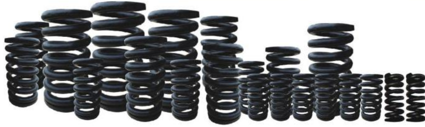
弹簧 TRACK SPRING