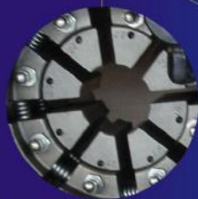
Electromagnetic reversing valves