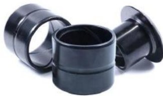
斗轴套 BUCKET BUSHING