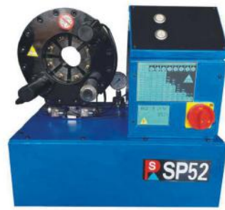
Hose Crimping Machine SP52

Motor power: 1.5~2.2KW Full Crimping Cycle:16~22s Weight: 130kg MAX Hose ID:52mm Dimensions: 600*450*650mm Accuracy:0.01mm Die Opening&Closing: 1-50mm Voltage:220V~380V