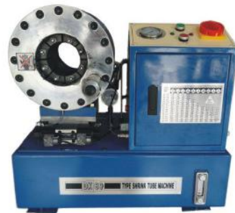
Hose Crimping Machine DX69

Motor Size: 3kw Full Crimping Cycle: 20s Weight: 200kg Max Hose Size: 6-51mm Dimensions: 650*450*650 Accuracy: 0.01mm Die Opening & Closing: 1-50mm Voltage: 220V