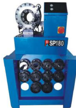
Hose Crimping Machine SP180