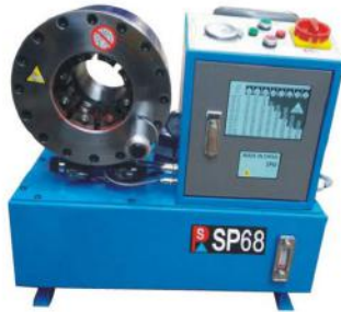
Hose Crimping Machine SP68

Die Opening&Closing:25-35mm Weight:200kg MAX Hose Size:68mm Motor Power:3kw Full Crimping Cycle:8s Accuracy:0.01mm Voltage:220V Dimensions:600*450*650mm