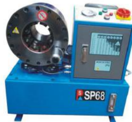
Hose Crimping Machine SP68