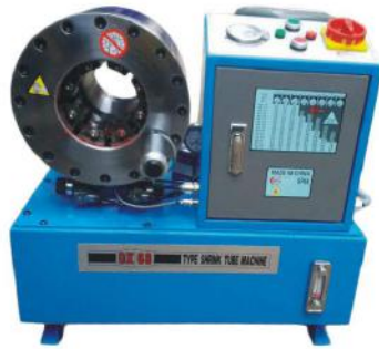
Hose Crimping Machine DX68

Motor Size: 3kw Full Crimping Cycle: 20s Weight: 200kg Max Hose Size: 6-51mm Dimensions: 650*450*650 Accuracy: 0.01mm Die Opening & Closing: 1-50mm Voltage: 220V