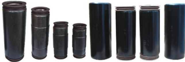
链通 TRACK BUSHING