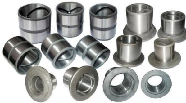
斗轴套 BUCKET BUSHING