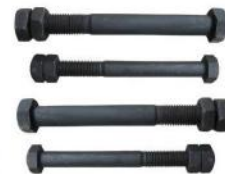
斗轴螺栓 BUCKET SPINDLE BOLT