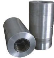
马拉头 BUCKET CYLINDER