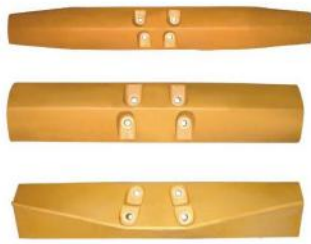
湿式链板 干式链板系列