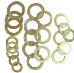
斗轴垫片 BUCKET GASKET