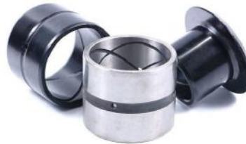
斗轴套 BUCKET BUSHING