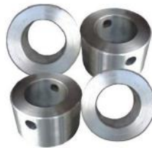
钢斗耳 STEEL BUCKET EAR