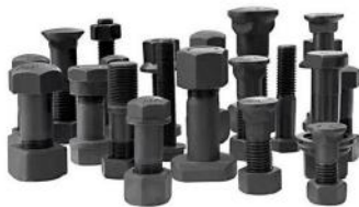
履带螺栓螺母 BOLT AND UNT