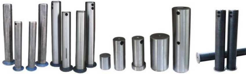
斗轴 BUCKET PIN