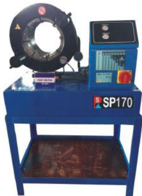
Hose Crimping Machine SP170