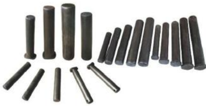
链肖 TRACK PINS